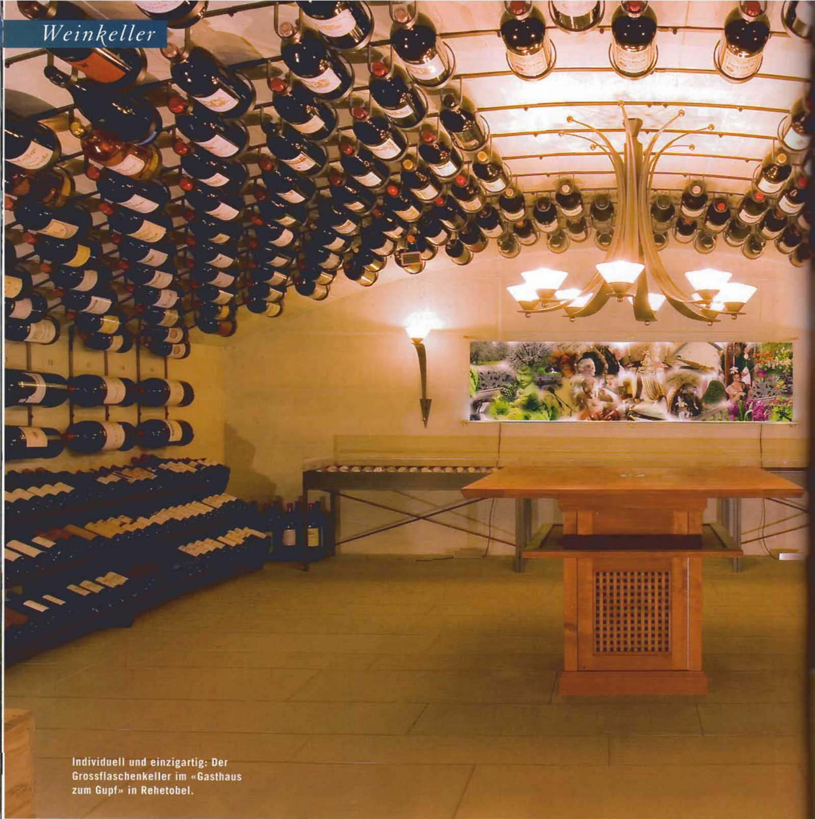
Individuell und einzigartig: Der Grossflaschenkeller im «Gasthaus zum Gupf» in Rehetobel.